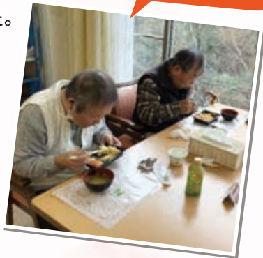
美味しいお寿司に舌鼓☆