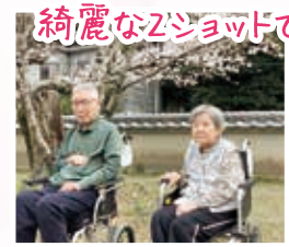
綺麗なZショット ですね!