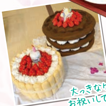
大きなケーキで お祝いしています♪

お誕生日をお迎えになられる月に、 誕生日会を行なっています！！ 大きなケーキを用意してます （食べられません） みなさんにはおやつに ケーキを召し上がってもらっています。 祝ってもらって感動の涙を 流される方もいらっしゃいました。