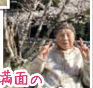
仲良く楽し そうですね♪ 満面の 笑顔ですね(^^^)