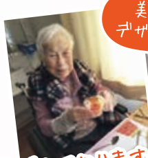
喜ばれてお りますね♪