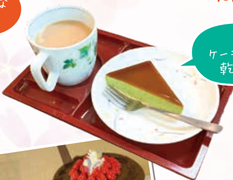
美味しい ケーキと飲み物で 乾杯します♪