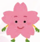
花見をされて 良い表情ですね♡

花見の季節となりました。皆様、桜の花に見とれて良い笑顔で喜ばれておられました。 天気もとても良く、良い気分転換になったと思います。