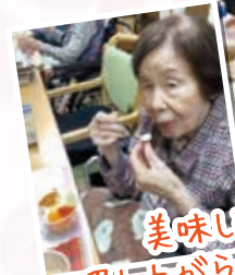
美味しく召し 上がられてますね (^▽^)