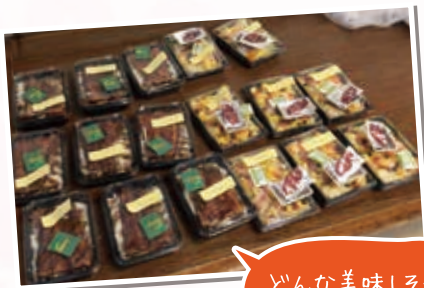
どんな美味しそうな 食事かな？