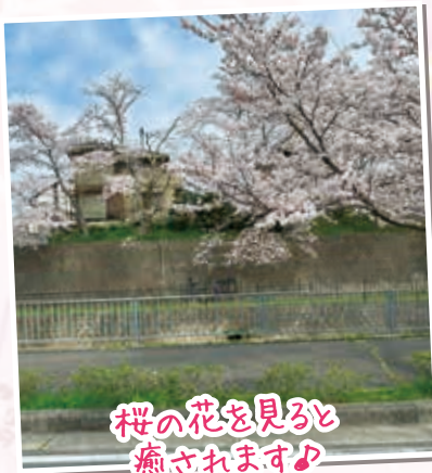
桜の花を見ると 癒されます♪

今年の桜は天候に恵まれ 例年より長い期間見ることができました。 デイでは猪名川町までドライブへ出掛け、 桜並木の絶景を見ていただきました。 「良いものを見せてもらいました！！」と 仰っていました。 晴れていたので圧巻の景色でした。