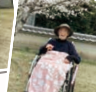
綺麗な桜を見 れて良かった ですね♪