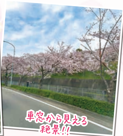
車窓から見える 絶景！！