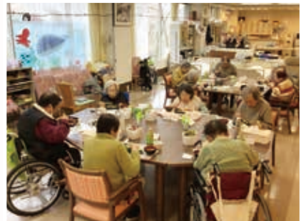
皆様、黙々と召し上がられています！

最終週の月曜・火曜に昼食を「銀のささ」へ外注しました！ うな重・にぎり盛り・ちらし寿司から選んでいただいたのですが、 一番人気はダントツでうな重でした！！ 「やっぱりお寿司は美味しいなあ〜」という お声が聴こえてくるかと思いましたが、 みなさん黙々と召し上がられていました。 美味しいものを食べている時、 言葉はなくなるものですねえ〜（笑）