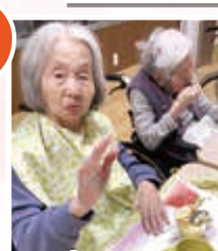
良い表情で ですね♡