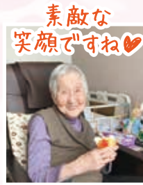
素敵な 笑顔ですね♡