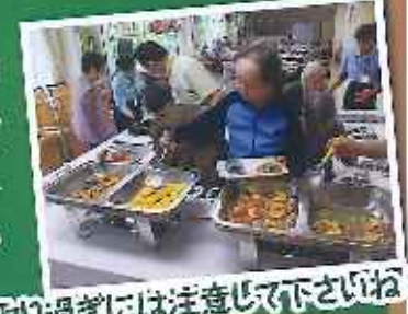
取り過ぎには注意して下さいね!!

15日の恒例になっている昼食バイキング。この日のメニューはおにぎり・鶏そぼろ丼・南蛮漬け・オムレツ・かぼちゃ煮・田楽・春菊のごま和え・若竹汁・フルーツでした。好きな物を好きなだけというだけあって、ほとんどの方は全種類取って残さず食べられており、皆様の胃袋には驚かされました。