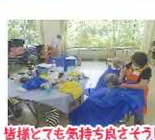
皆様とても気持ち良さそう! つい居眠り!