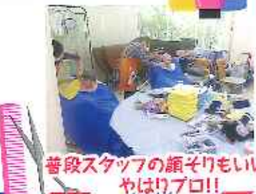
普段スタッフの顔そりもいいが、 やはりプロ!!

編集後記 梅雨が明け、夏に入ると36℃以上の猛暑日が続いていますが、皆様はいかがお過ごしでしょうか。高校野球が始まりテレビを見て応援する利用者様の姿も気合が入っています。夏祭りや花火などのイベントに利用者様の皆様が参加され楽しかったよ!と喜んでくれたりと笑顔が多くみられます。これからも皆様に参加して頂けるよう、熱中症など体調不良にならないよう水分補給を心がけ、この暑い夏を一緒に乗り越えていきたいと思っております。 編集 菅原 裕美