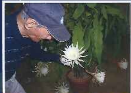
毎朝水をやうてくおている成果!!!