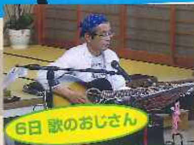
6日 歌のおじさん いつも盛り上げて いただいています!!