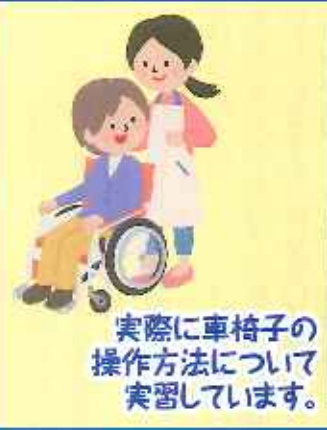
実際に車椅子の 操作方法について 実習しています。