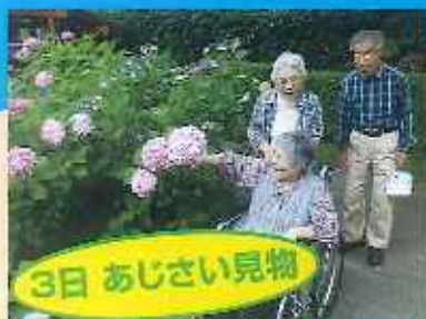
3日 あじさい見物 顔の大きさがうらやまね。