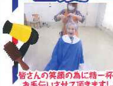
皆様の笑顔の為に精一杯 お手伝いさせていただきます!