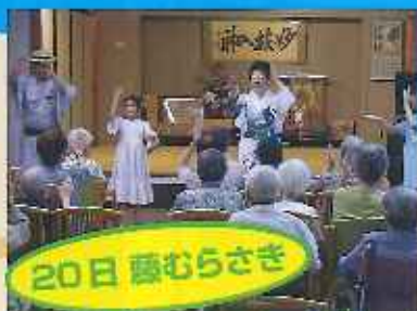
20日 藤むらさき あおいちゃんもすっかり 大きくなりました。