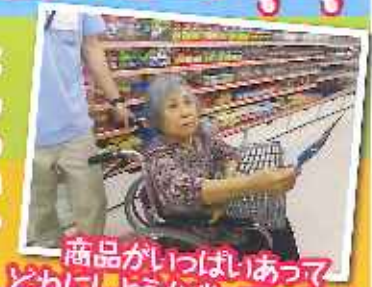
商品がいっぱいあって どれにしようか迷っていました。

5月・6月と連続して多田にある108円ショップにお買い物へ行ってきました。広いフロアにたくさんの商品があり、こんなものが108円で売っているのかと驚かされていました。600円程度の予算の中でお菓子をかう方、実用的な物を買う方など色々でしたが、皆様手にとり品定め一生懸命でした。