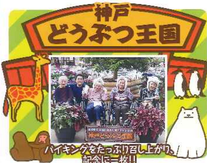
ハイキングをたっぷり召し上がり、記念に一枚!!