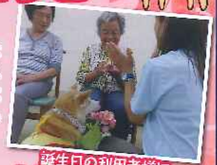
誕生日の利用者様に ふくちゃんからプレゼントを もらいました!!

テレビでも取り上げられる人気のセラピー犬のふくちゃんともえちゃんが遊びに来てくれました。おっとりな性格のふくちゃんと元気いっぱいのもえちゃんに皆様の顔がゆるみっぱなしでした。