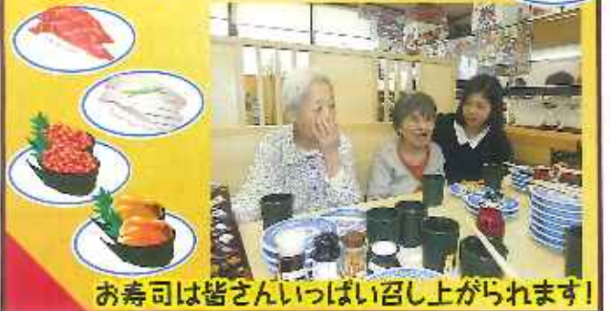
お寿司は皆さんいっぱい召し上がられます!