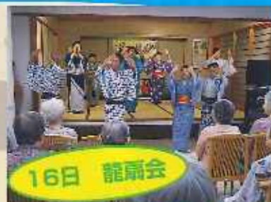
16日 龍扇会 元気いっぱい かもらいました。